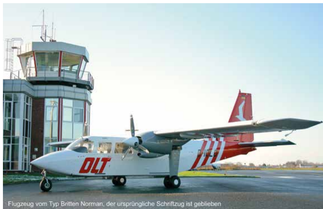
Flugzeug vom Typ Britten Norman, der ursprüngliche Schriftzug ist geblieben

individuell durchgeführt. Unter www.fliegofd.de stehen Fahrpläne, Tarife und Informationen zum Unternehmen online bereit.