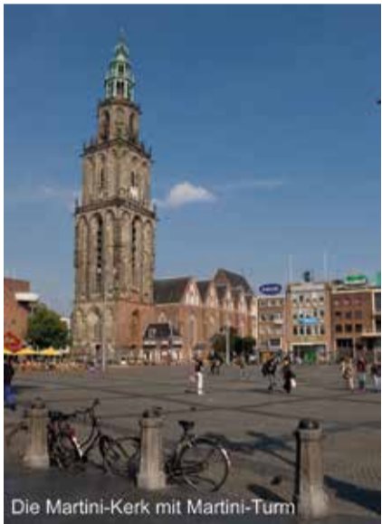
Die Martini-Kerk mit Martini-Turm

- sich die Innenstadt am besten zu Fuß, mit dem Fahrrad oder bei einer Bootsfahrt über die Grachten erkunden lässt