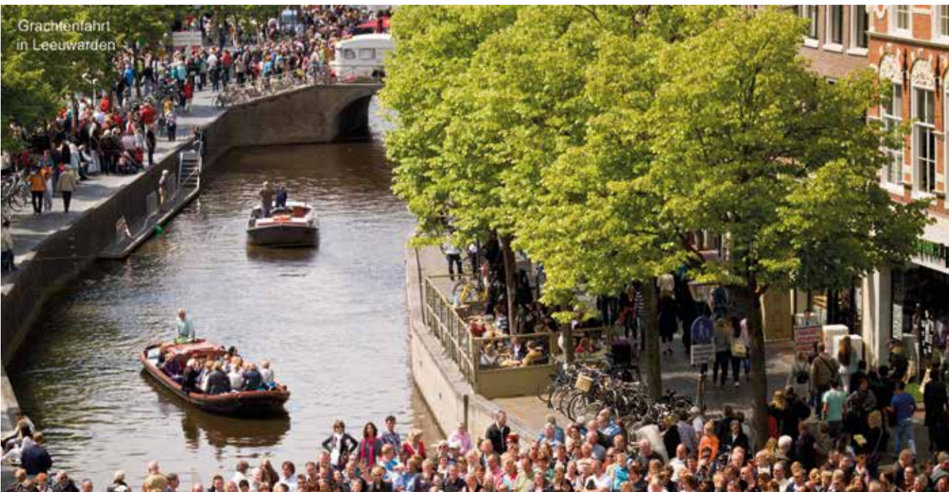
Grachtenfahrt in Leeuwarden

- die "VV NL app" alle Informationen über Leeuwarden aufs Smartphone holt