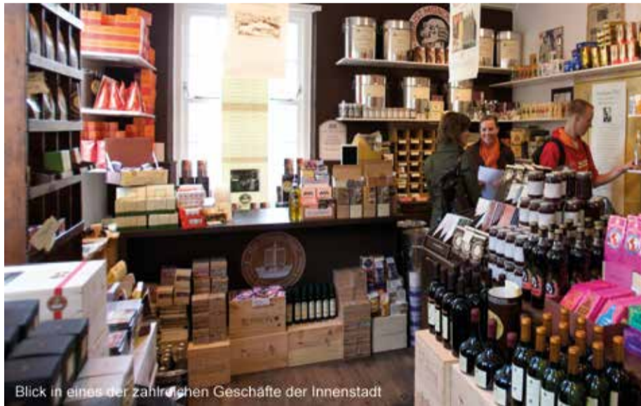
Blick in eines der zahlreichen Geschäfte der Innenstadt